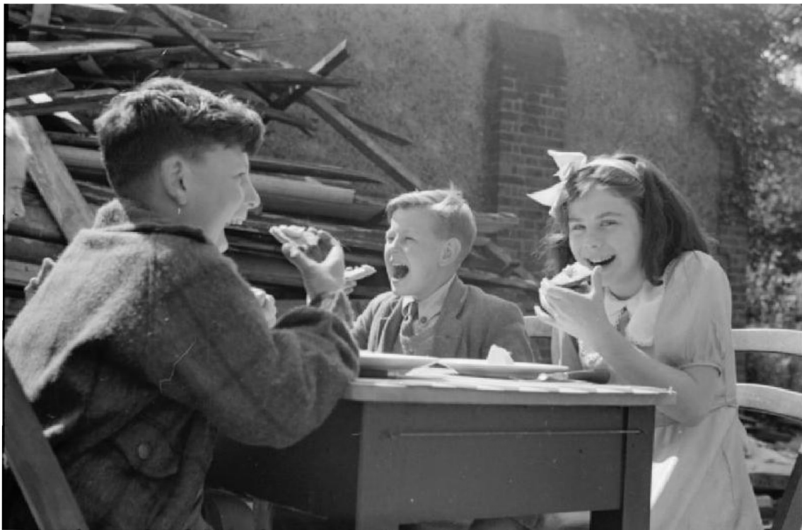
Copiii dintr-o școală britanică bombardată care mănâncă mâncare din SUA trimisă ca parte a programului de împrumut-închiriere.

Cu puterile Axei – Germania, Italia și Japonia – mobilizându-se în mod clar pentru război, Aliții – SUA, Marea Britanie, Franța și Rusia Sovietică – s-au pregătit pentru un alt conflict global. Rusia Sovietică (URSS), temându-se de atacurile germane, a folosit economia pe timp de pace pentru a-și construi armata – la fel ca Germania. Din 1938 până în 1941, liderul rus Iosif Stalin și-a dublat dimensiunea armatei la cinci milioane de soldați. Pentru a-i plăti, toate gospodăriile rusești au trebuit să consume mai puține alimente, combustibil și alte resurse. Acest lucru nu ar fi mers la fel de bine în majoritatea națiunilor. Dar Rusia sovietică avea o "economie de comandă". A dat statului controlul asupra tuturor industriilor, inclusiv fermelor și alimentelor pe care le produceau. Acest nivel de control guvernamental a oferit URSS un avantaj atunci când a venit vorba de mobilizarea resurselor și a forței de muncă industriale pentru război. Majoritatea națiunilor s-au străduit să se adapteze la economia totală de război. Cu toate acestea, economia de comandă a Rusiei era deja aproape de acest concept. A fost mai ușor să ceri cetățenilor și companiilor să se alăture efortului de război.