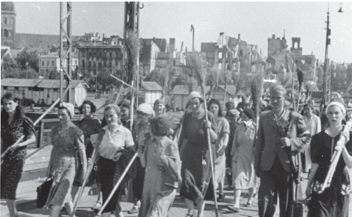
Muncitori forțați în Lituania ocupată de germani.

O privire asupra fundalului va ajuta la ilustrarea modului în care diferite națiuni au avut motive economice similare în timp ce s-au mobilizat (pregătit) pentru război. Pentru început, Marea Depresiune tocmai provocase o criză globală. Germania, încă suferită de înfrângerea din Primul Război Mondial, a fost lovită în mod deosebit. Când Adolf Hitler a promis să pună capăt suferinței economice și umilirii poporului german, partidul său politic a ajuns la putere. Pentru a crea locuri de muncă – de care economia avea nevoie cu disperare – guvernul lui Hitler a crescut cheltuielile militare. Companiile germane au primit contracte guvernamentale profitabile. O parte a planului lui Hitler a fost să folosească această nouă putere militară pentru a invada țările vecine. Acolo, avea să ia resurse și bunuri industriale pentru a-și promova viziunea despre o Germanie Mare. Desigur, viziunea sa a cerut și "puritatea" rasială și etnică a acestei zone extinse. Acest plan prevedea, de asemenea, îndepărtarea sau uciderea multor populații din regiunile cucerite. Unii dintre oamenii din aceste țări au fost, de asemenea, forțați să devină muncitori neplătiți – în esență sclavi – ai mașinii de război germane. La fel și grupurile minoritare din Germania.